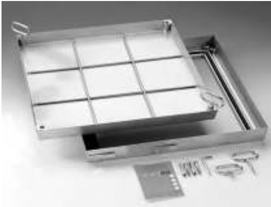
Τύπος BVE από ανοξείδωτο χάλυβα